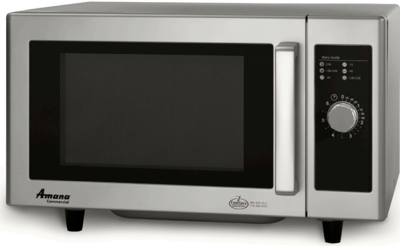
Se muestra modelo RMS10DS